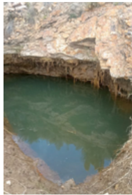
Comunidad de Hachayapu. Han impartido un taller de captación de riego por aspersión. Se pueden ver los campos, el "ojo de agua" del que sacan para regar los cultivos y el consumo humano y la acogida de la comunidad.