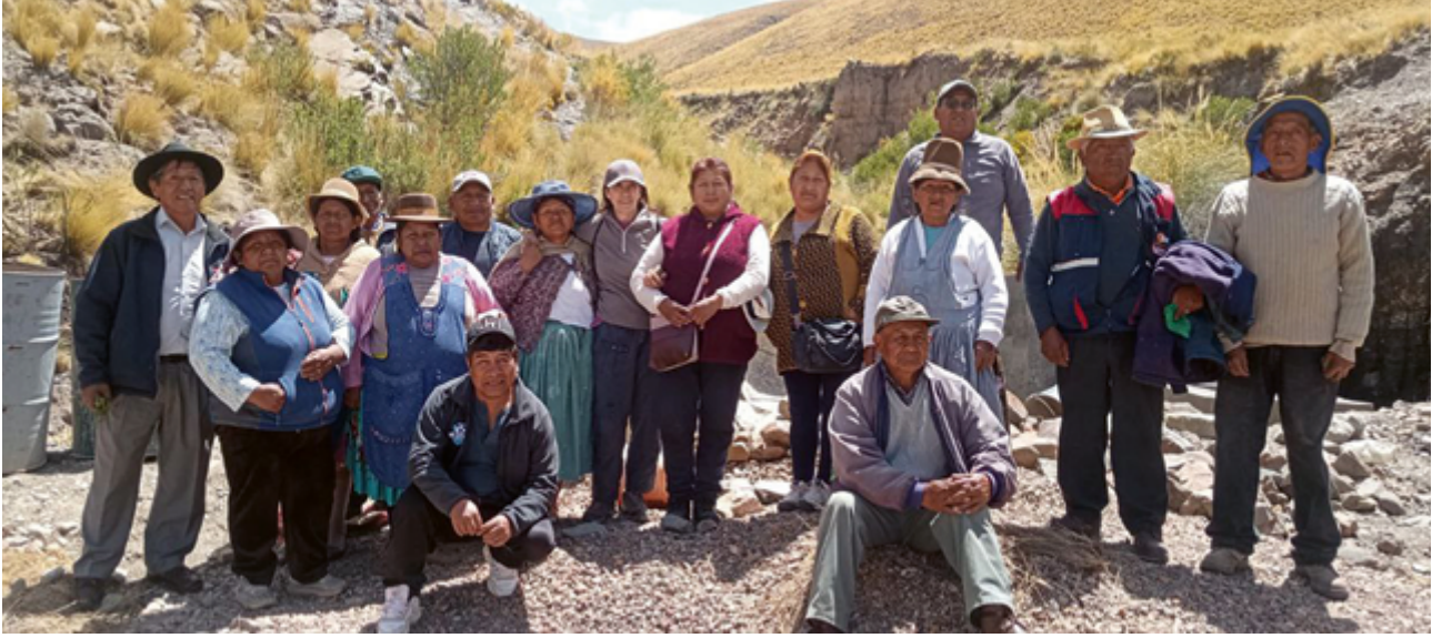
El proyecto que ha subvencionado el Ayuntamiento de Zaragoza en la comunidad de Huayoco consiste en la instalación de tuberías para el riego de los cultivos y el municipio ha construido una pequeña presa