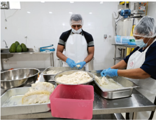
FUCANISTEC, Manipulación de pulpas frutales

do por primera vez un enfoque psicosocial especializado que responde a problemáticas cada vez más complejas.