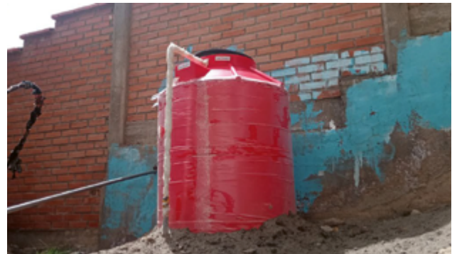
El proyecto subvencionado por el Ayuntamiento de Zaragoza ha posibilitado la instalación de dos tanques de agua en dos colegios del altiplano así como en el invernadero de uno de los centros

Uno de los principales logros del proyecto ha sido la mejora efectiva del acceso al agua tanto para consumo humano como para la producción agrícola. En comunidades como Huaylloco o Totorá Alta, la instalación de tuberías, tanques y sistemas de microriego ha reducido de forma significativa las distancias y el tiempo que las familias debían dedicar a la recolección de agua. Este cambio ha tenido un impacto directo en la calidad de vida, especialmente para mujeres y personas mayores, tradicionalmente responsables de esta tarea.