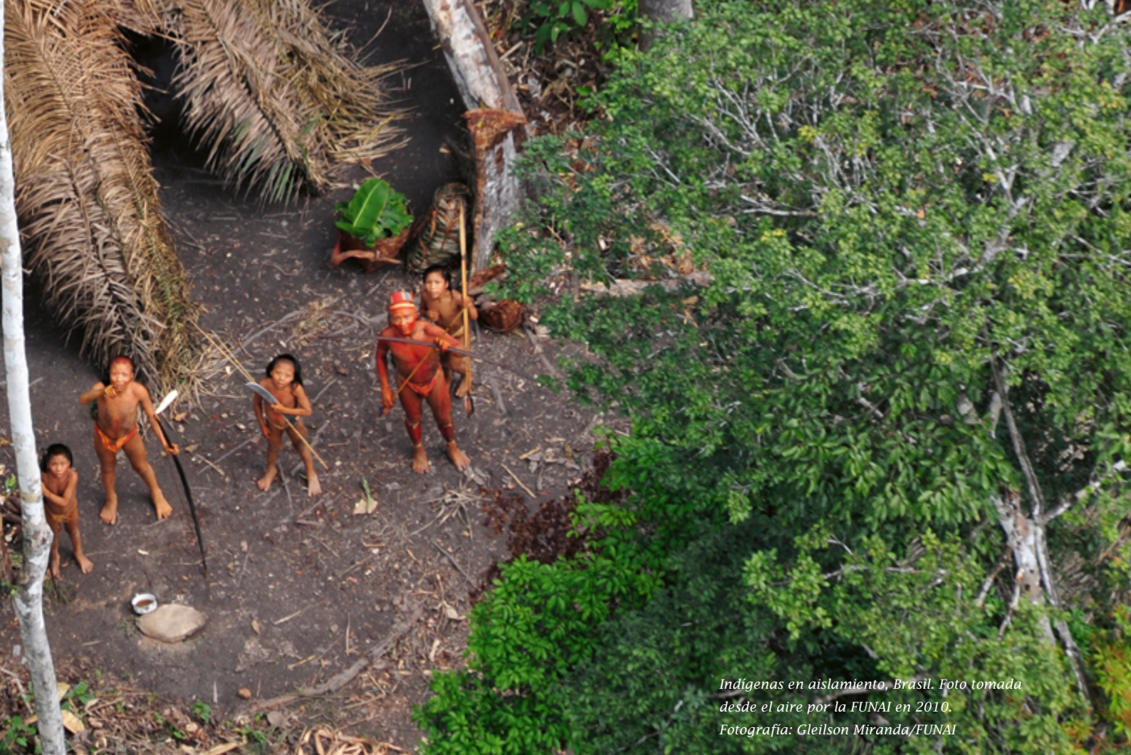
Indígenas en aislamiento, Brasil. Foto tomada desde el aire por la FUNAI en 2010.

El informe revela que existen 196 pueblos y grupos indígenas en aislamiento: repartidos por bosques y selvas de América del Sur, Asia y el Pacífico, luchan contrarreloj para tener un futuro al que mirar. Si no se pone fin a la invasión y al robo de sus territorios, en solo una década la mitad de ellos podrían ser aniquilados.