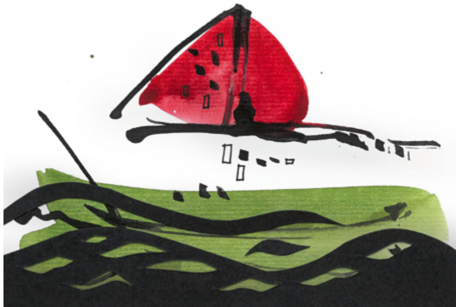
Postal de felicitación del año del Celan, obra de Joss López, de "Postales desde el limbo", otra visualización de esperanza.