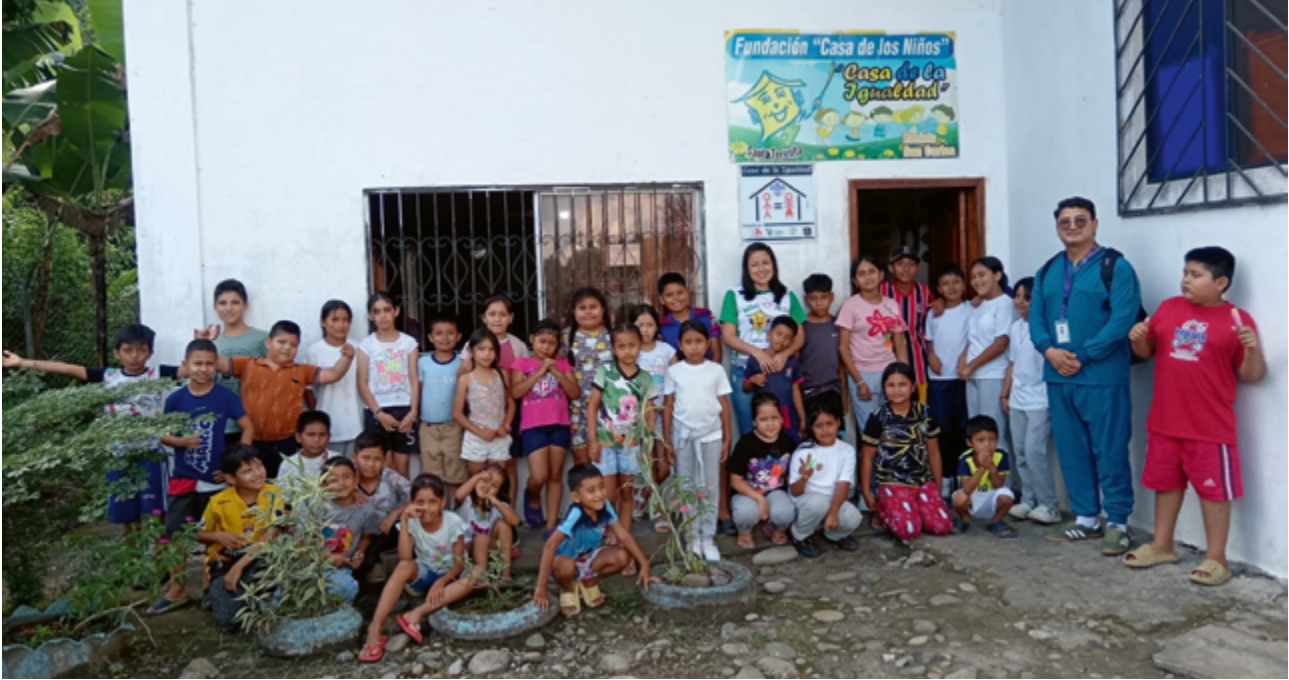
FUCANISTEC, Casa de los Niños San Carlos