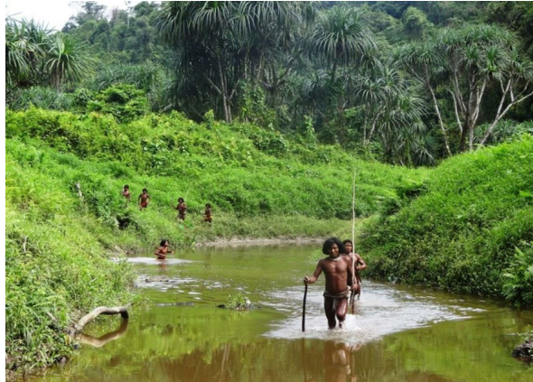
Los shompen viven en la isla india Gran Nicobar. Si su selva y sus ríos son destruidos, ellos también lo serán.

.El megapuerto valorado en 5.000 millones de dólares proyectado en la isla Gran Nicobar en el océano Índico, al que se sumará un plan de "desarrollo", tiene previsto transformar la pequeña isla natal de los shompen en el "Hong Kong de la India", con una nueva ciudad de unos 650.000 habitantes. Como los shompen no pueden dar su consentimiento libre, previo e informado, el plan es ilegal según el derecho internacional.